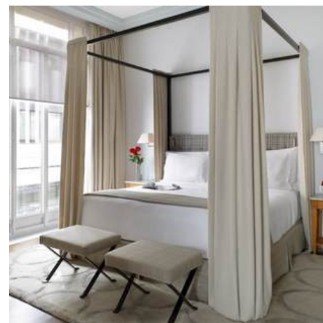
FAMILY ROOM & FAMILY SUITE