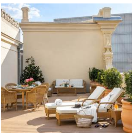
URSO SUITE TERRAZA